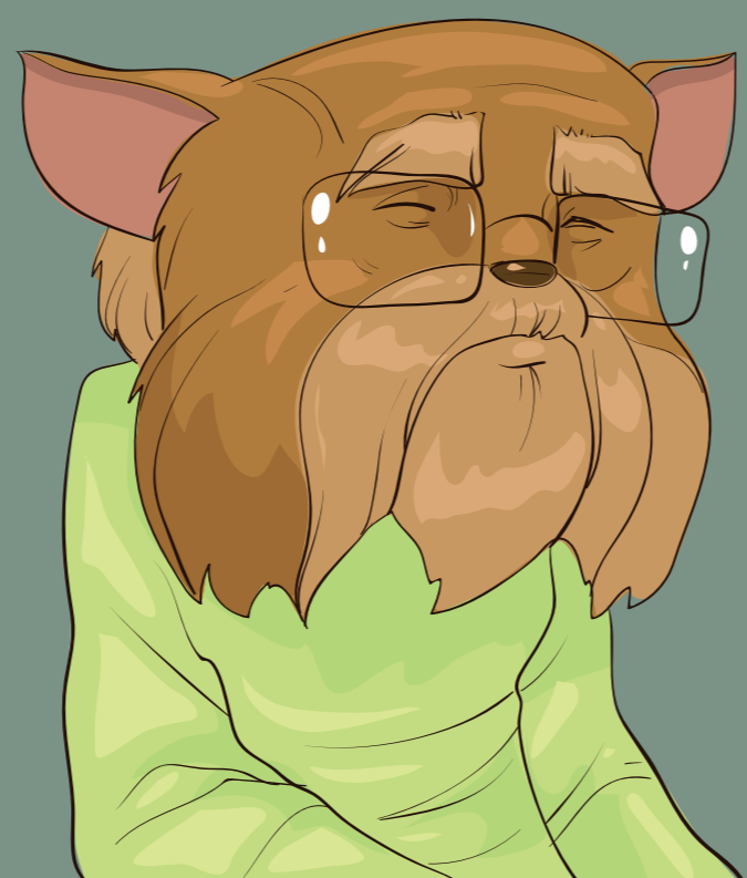
Helmut Großvater (Opa)