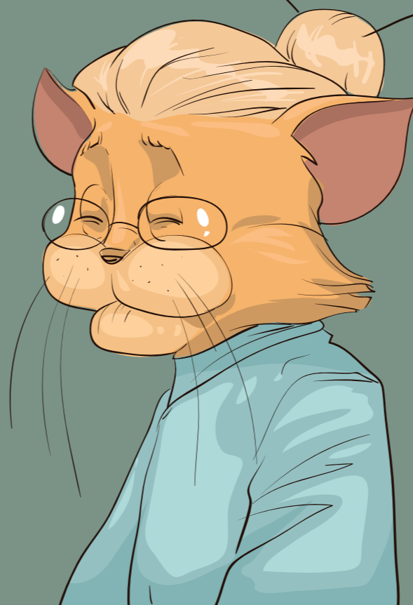
Theresa Großmutter (Oma)